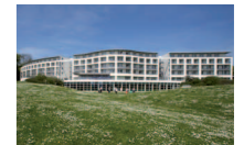
KLINIKEN SCHMIEDER KONSTANZ