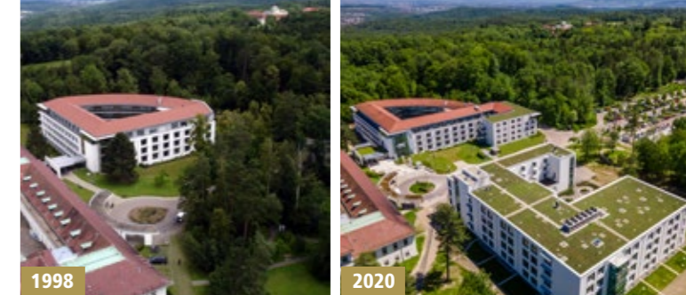
Die Entwicklung des Klinikcampus auf der Schillerhöhe mit dem Haus Solitude (l.) aus dem Jahr 1998 sowie mit dem Haus Bärensee (r.) in 2020

Ein Infopoint befindet sich im Empfangsgebäude.